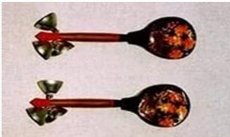
Ложка с колокольчиками