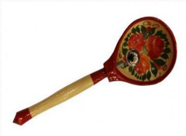
Ложка с бубенцом